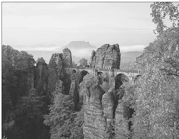
Bild der Basteibrücke im Blickfang für Millionen

Der Bekanntheitsgrad der Basteibrücke mit den Sandsteinfelsen der Sächsischen Schweiz hat durch das serienmäßige Hintergrundbild von Windows 7 einen neuen Aufschwung erhalten. Jeder Nutzer des neuen Betriebssystems von Microsoft erhält nach der Installation Hintergrundbilder automatisch angeboten. Darunter ist das Bild der Basteibrücke. Ein Vorgang der früher oder später den größten Teil aller Computer in Deutschland erreicht und somit ein Millionen Publikum.