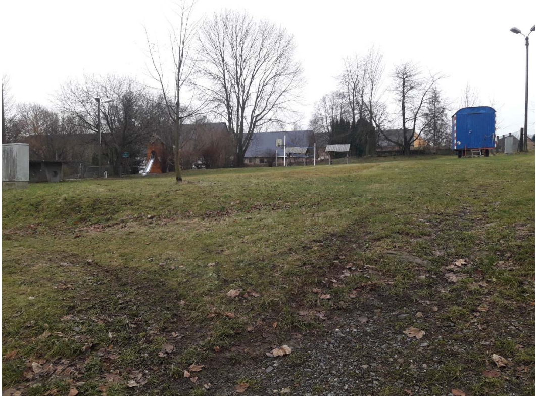
Blick von der Schulgasse in Richtung Südosten zum Spielplatz