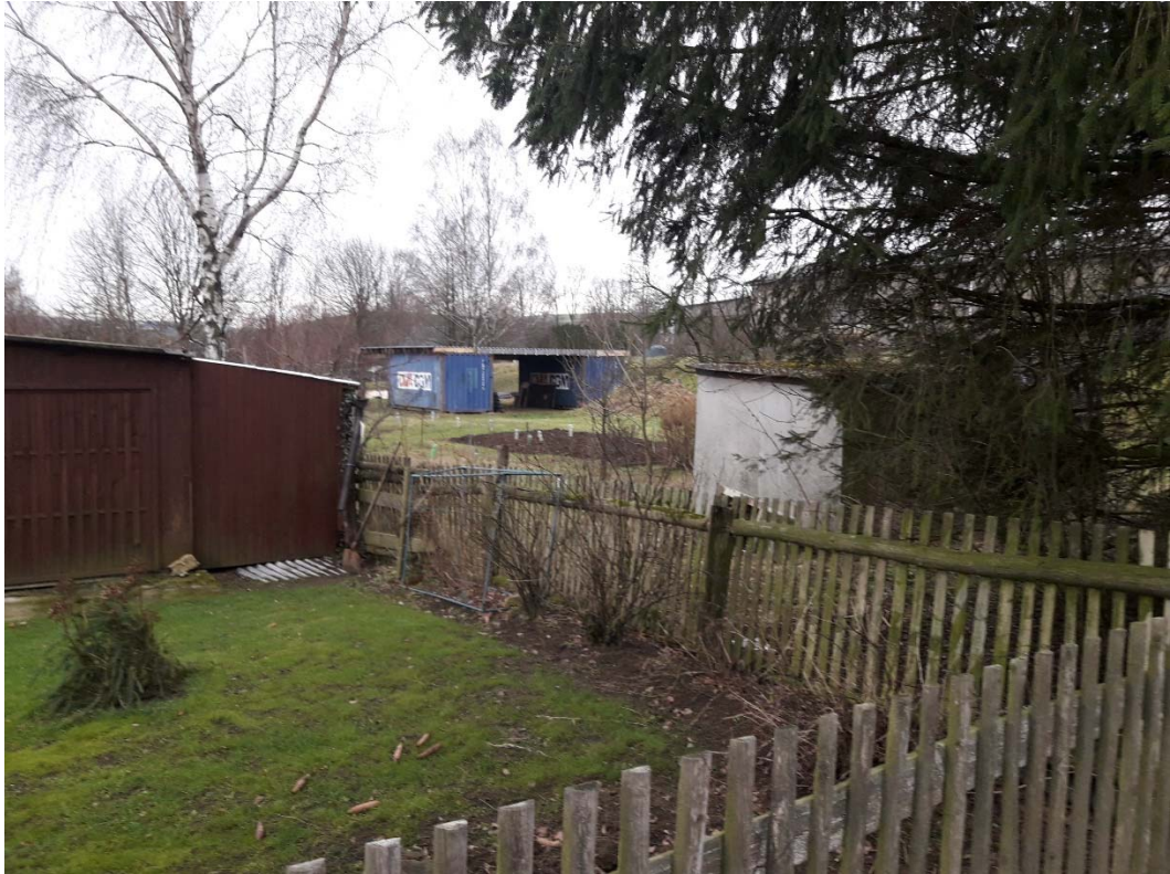
Kleingärten mit Lagergebäuden