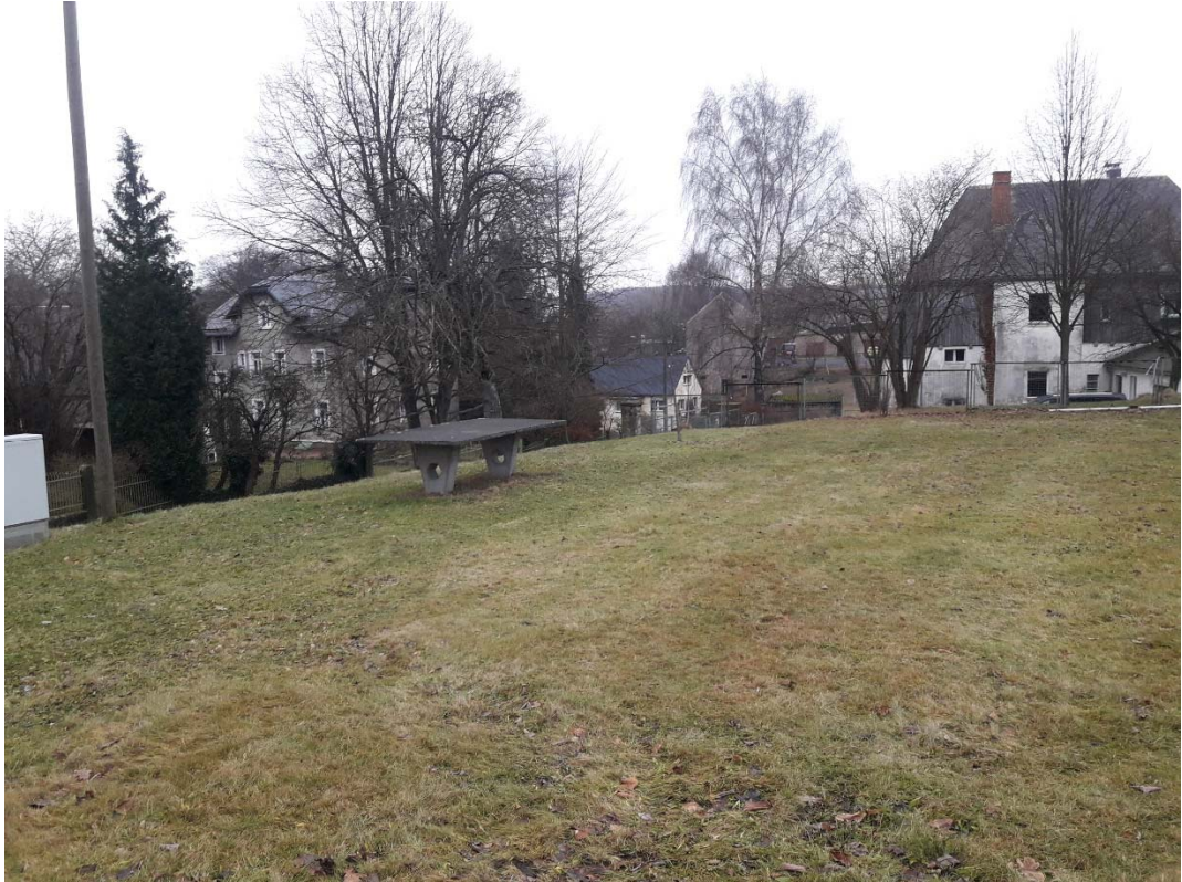
Geplanter Standort Dorfgemeinschaftshaus