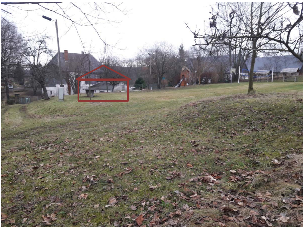
Blick von der Parkfläche an der Schulgasse zur ehemaligen Schule mit Darstellung des geplanten Gebäudestandortes