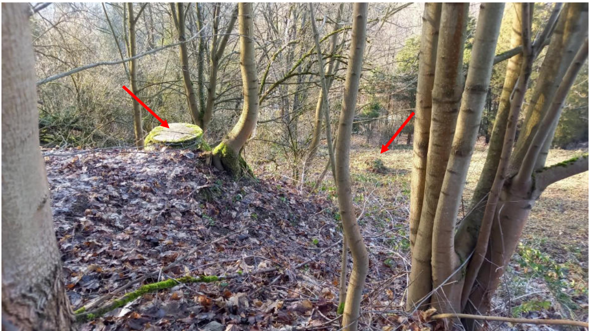
Schächte im Ablauf