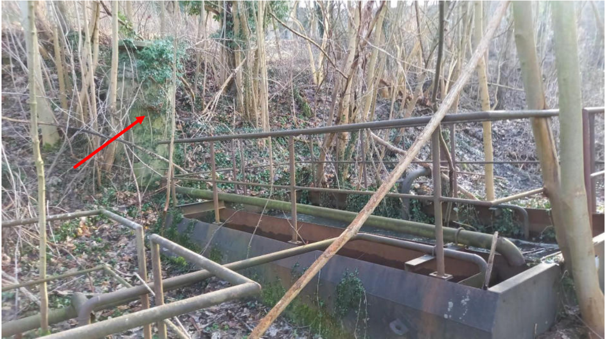
Becken 1 mit Zulaufschacht